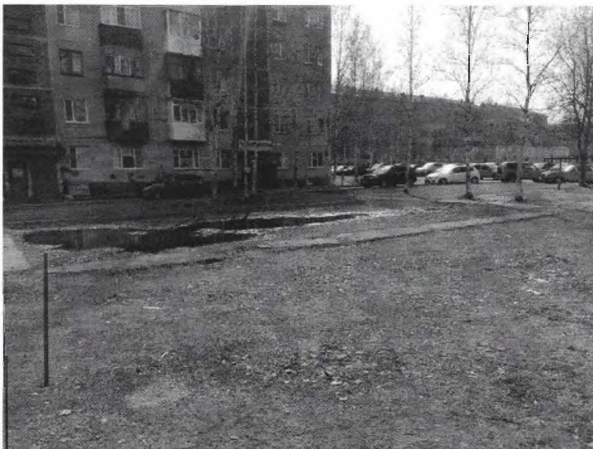
3.4. Информация о собственнике объекта: земли общего пользования.