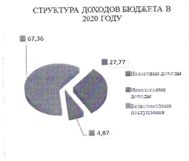
Диаграмма № 2