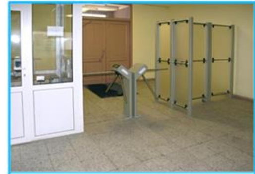
УЧРЕЖДЕНИЕ ИЛИ ОРГАНИЗАЦИЯ